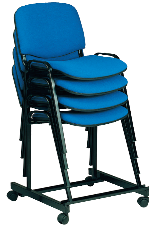
6000 COMMUNITY CHAIR